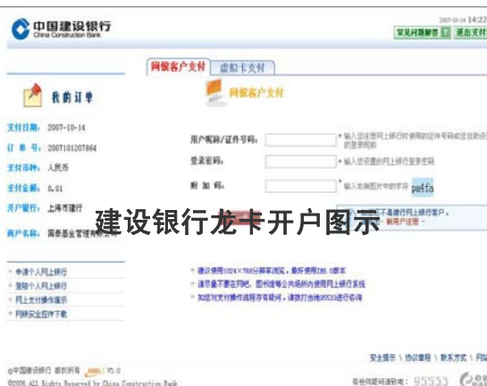
建设银行龙卡开户图示

第二步，选择进入您所适用的银行卡的身份验证页面，并正确填写个人真实有效的信息，本公司网上直销系统目前支持建设银行龙卡、农业银行金穗卡、银联通兴业银行借记卡和招商银行一卡通网上基金交易功能。图示如下：