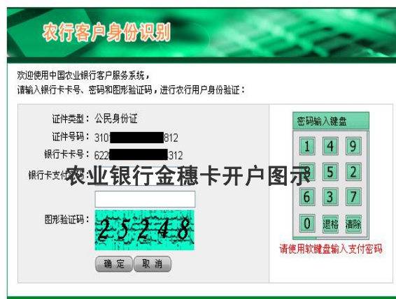
农业银行金穗卡开户图示